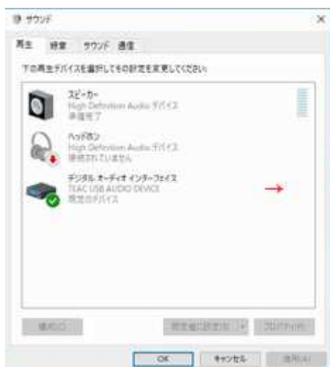
図2：レベルメーター非表示