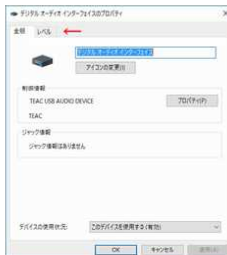
図3：設定タブ非表示