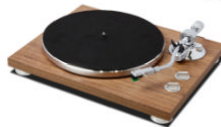
コンセプト賞 アナログレコードプレーヤー アナログレコードプレーヤー (10万円未満) Bluetooth®トランスミッター搭載 アナログターンテーブル 『TN-400BT』