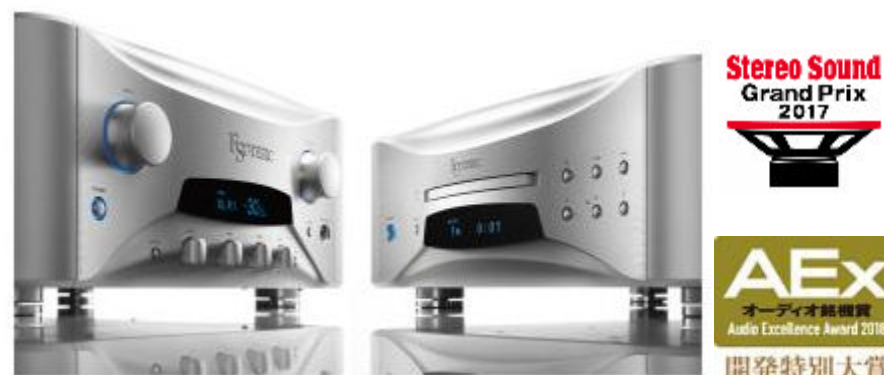
SACD Player 『grandioso K1』

2016年10月に発売を開始して以来ご好評いただいております『grandioso K1』と『grandioso F1』が音元出版のオーディオ銘機 2018 の製品特別大賞を受賞いたしました。これまでESOTERIC が培ってきた技術を注ぎ込んだ grandioso シリーズは、トランスポートや DAC、プリ/パワーアンプといった、セパレートシステムを販売して参りました。『grandioso K1』と『grandioso F1』は、それらすべての技術を結集した一体型プレーヤーとプリメインアンプです。