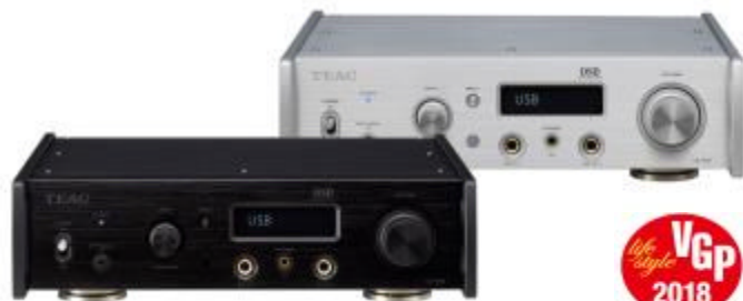
デスクトップオーディオ大賞 DAC/DDC(10万円以上25万円未満) USB DAC/ヘッドホンアンプ 『UD-505』

ティアックでは、11月に発表した『UD-505』がデスクトップオーディオ大賞、9月に発売した『TN-400BT』がコンセプト賞を、それぞれ受賞いたしました。