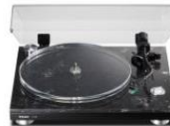
アナログレコードプレーヤー (10万円未満) アナログレコードプレーヤー アナログターンテーブル 『TN-550』