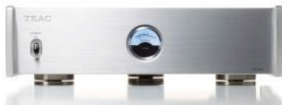
オーディオインターフェース/クロックジェネレーター クロックジェネレーター(50万円以下) マスタークロックジェネレーター 『CG-10M』